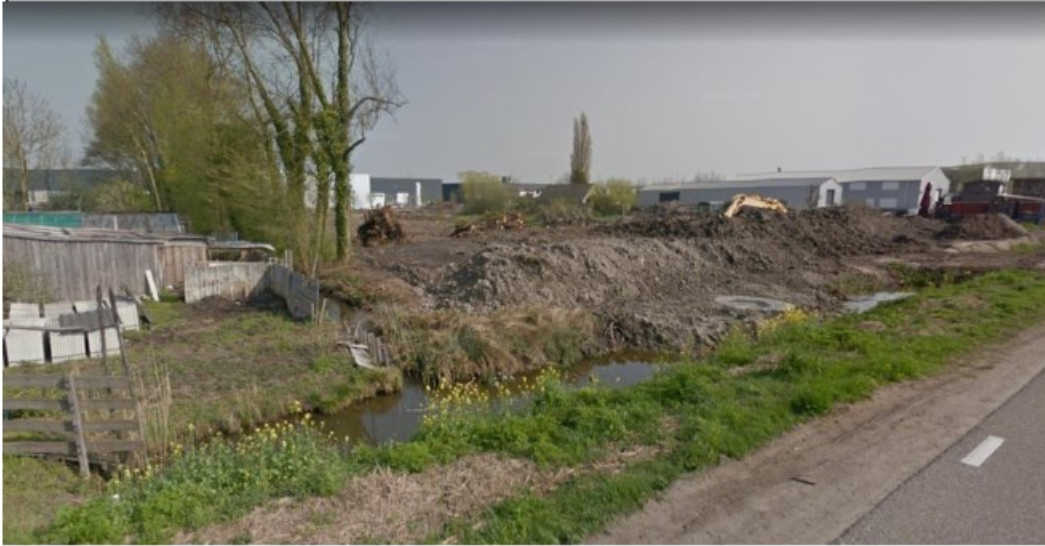
Huidige situatie van het plangebied

Het opnamevermogen van het natuurlijk milieu