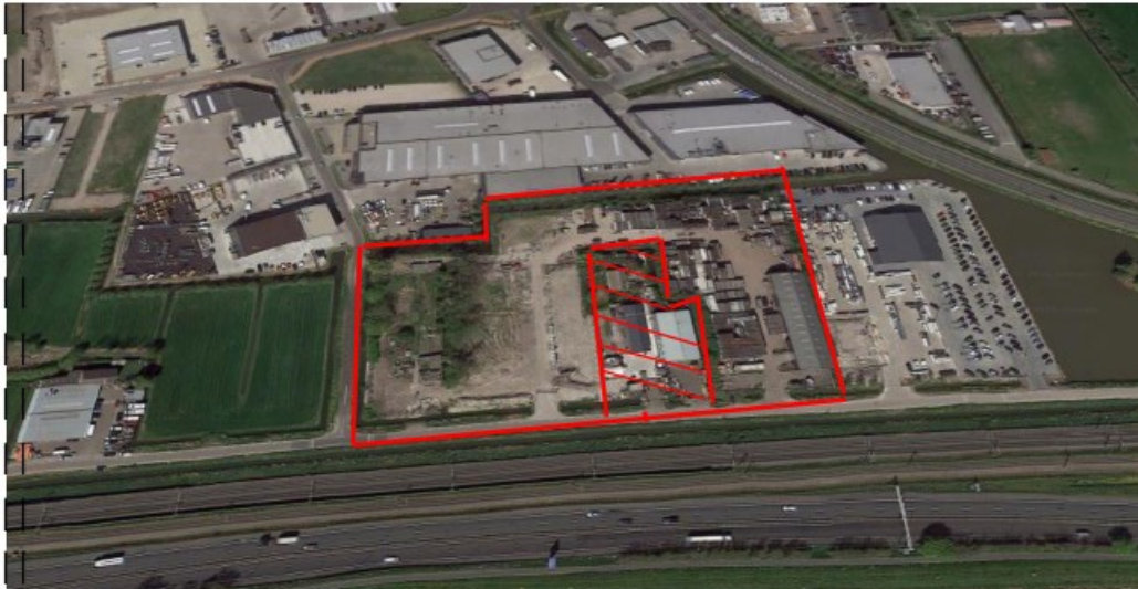
Figuur 2: Uitgebreid perceel met uitzicht op nieuwe bedrijventerrein Schelluinen en links de Rietweg (noordkant)

In de bijlage van het Besluit m.e.r. zijn twee onderdelen (C en D) opgenomen. In onderdeel C zijn activiteiten genoemd waarbij direct sprake is van een m.e.r.-plicht als bij besluiten de genoemde drempelwaarden worden overschreden. Voor de activiteiten die zijn genoemd in onderdeel D geldt dat als de drempelwaarden worden overschreden een m.e.r.-beoordeling dient plaats te vinden. Voor besluiten met een omvang onder de drempelwaarden moet een zogenaamde vormvrije m.e.r.-beoordeling worden gedaan.