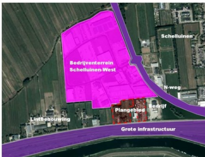
Kaartbewerking luchtfoto met ligging plangebied in omgeving

De 'discussie' of de ontwikkeling nu binnen of buiten bestaand stedelijk gebied wordt gerealiseerd wordt ondersteund door het provinciaal beleid van de provincie Zuid-Holland. In de onderstaande afbeelding is de aanduiding van de bebouwde ruimte in de Visie Ruimte en Mobiliteit van de provincie Zuid-Holland, die gold tot en met 1 april 2019, weergegeven. Hierop is duidelijk te zien dat het plangebied binnen de bestaande bebouwde ruimte is gelegen.