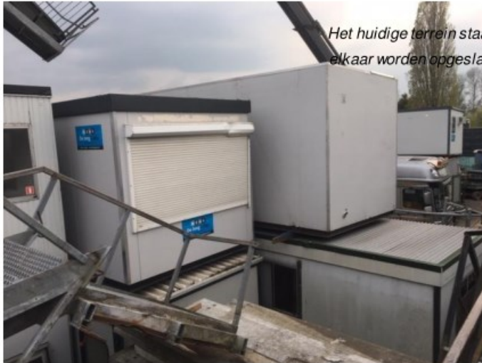
Het huidige terrein staat vol, waardoor cabins gestapeld en dicht op elkaar worden opgeslagen met schade tot gevolg.

wenselijk is. Aan de Laddervoorwaarde wat betreft 'behoefte' wordt dus voldaan.