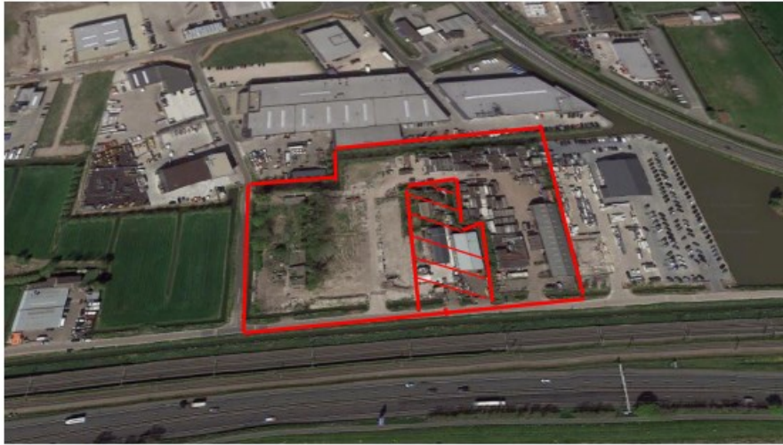
Figuur 2: Uitgebreid perceel met uitzicht op nieuwe bedrijventerrein Schelluinen en links de

N216 en de A15. Het huidige plangebied vormt daarom een zeer gunstige locatie voor het bedrijf.