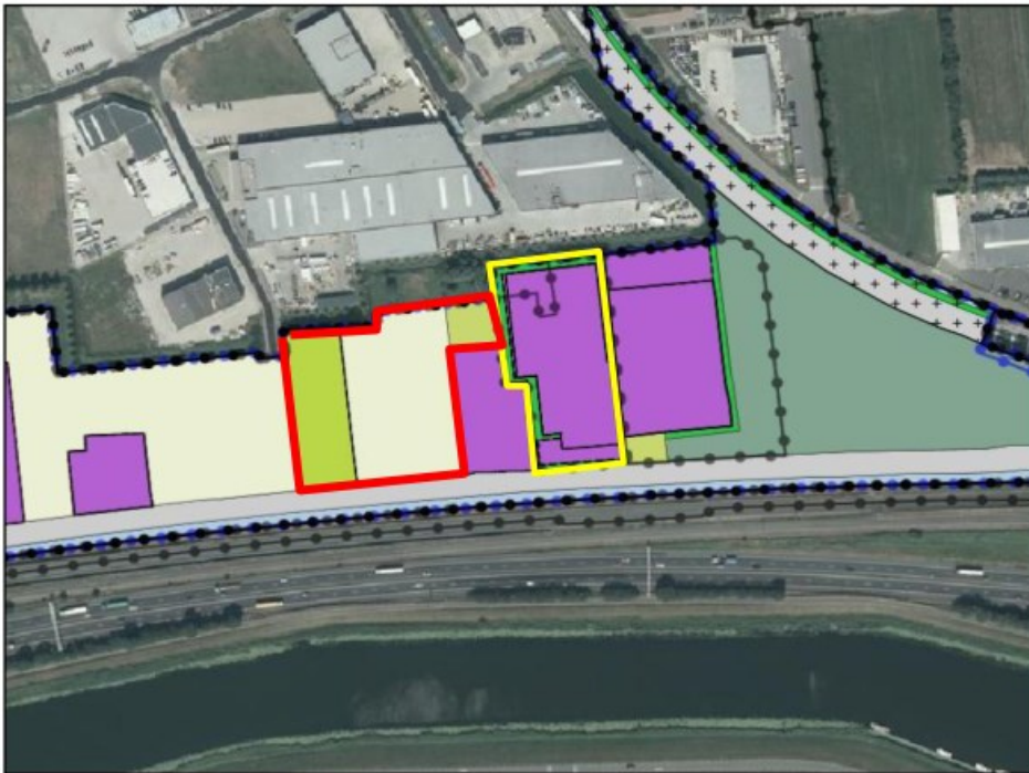
Uitsnede juridisch-planologische situatie met daarop het bestaande bedrijf (globaal geel omlijnd) alsmede de beoogde uitbreiding (globaal rood omlijnd) weergegeven.

De 'discussie' of de ontwikkeling nu binnen of buiten bestaand stedelijk gebied wordt gerealiseerd wordt ondersteund door het provinciaal beleid van de provincie Zuid-Holland. In de onderstaande afbeelding is de aanduiding van de bebouwde ruimte in de Visie Ruimte en Mobiliteit van de provincie Zuid-Holland, die gold tot en met 1 april 2019, weergegeven. Hierop is duidelijk te zien dat het plangebied binnen de bestaande bebouwde ruimte is gelegen.