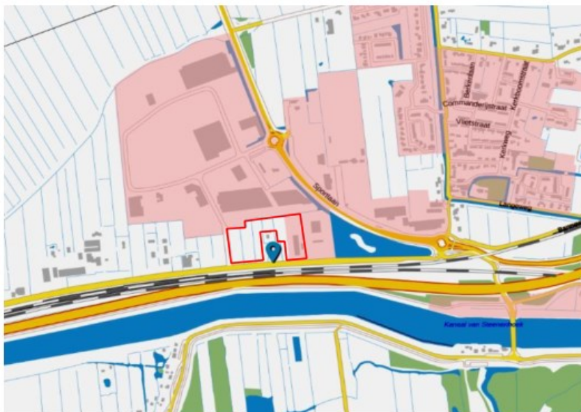
Omgevingsvisie Zuid-Holland, aanduiding bestaand stads- en dorpsgezicht (BSD). Het plangebied (bestaand bedrijven uitbreiding) is met rode stippellijn aangeduid. Het huidige terrein bevindt zich binnen het BSD, het naastgelegen bedrijf en de beoogde uitbreidingslocatie buiten het bestaand BSD.

Momenteel geldt evenwel de recentelijk (1 april 2019) in werking getreden Omgevingsvisie van de provincie Zuid-Holland, waarin het uitbreidingsgebied niet wordt aangemerkt als onderdeel van het Bestaand Stads- en Dorpsgezicht (hierna: BSD); zie onderstaande afbeelding.