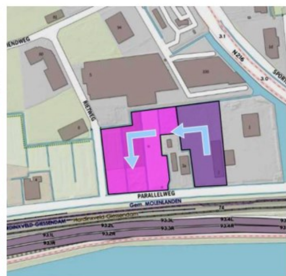
Schematische voorstelling nieuwe bedrijfssituatie

Middels de uitbreiding neemt allereerst de (opslag)capaciteit van het terrein toe en wordt de manoeuvreerbaarheid voor vrachtverkeer in de toekomst gewaarborgd. Tevens kunnen de cabins door de toenemende opslagcapaciteit op een meer zorgvuldige manier worden opgeslagen, wat leidt tot een Geconcludeerd wordt dat uitbreiding van [REDACTED] vermindering van de schade als gevolg van opslag (zie navolgende foto). Bijkomend voordeel hiervan is dat de uitstraling van het terrein minder rommelig en juist meer georganiseerd zal ogen, doordat het terrein ruimer wordt opgezet. De ruimtelijke kwaliteit van het terrein, alsmede de uitstraling naar diens omgeving, wordt daarom middels dit plan aanzienlijk verhoogd.