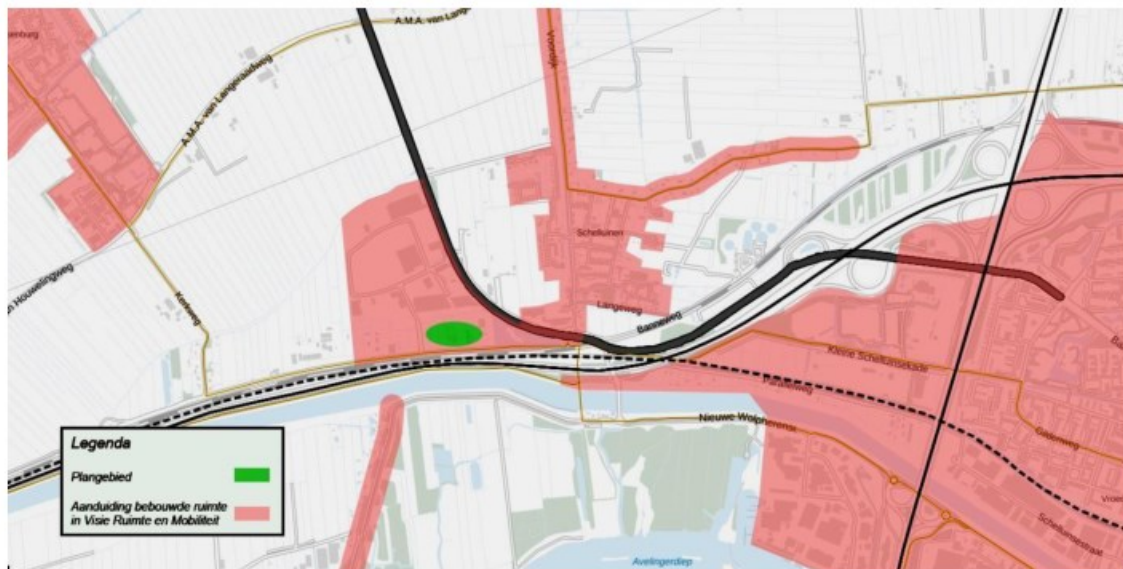
Uitsnede Visie Ruimte en Mobiliteit: Beter benutten bebouwde ruimte (geconsolideerd, in werking per 15 februari 2019, geldend tot 1 april 2019). Bewerking: SAB

Momenteel geldt evenwel de recentelijk (1 april 2019) in werking getreden Omgevingsvisie van de provincie Zuid-Holland, waarin het uitbreidingsgebied niet wordt aangemerkt als onderdeel van het Bestaand Stads- en Dorpsgezicht (hierna: BSD); zie onderstaande afbeelding.