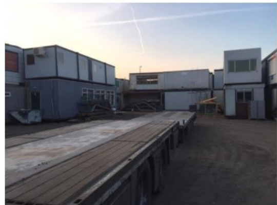
1 Noodzakelijk achterwaarts geparkeerde vrachtwagen op het terrein, doordat er geen mogelijkheid meer is om te keren.

De bedrijfsvoering van [REDACTED] betreft de productie, verhuur, lease en in- en verkoop van multifunctionele cabins, welke momenteel voornamelijk als tijdelijk gebouw functioneren gedurende nieuwbouwwerkzaamheden. De omzet van het bedrijf is de afgelopen jaren fors toegenomen, wat verklaard kan worden vanwege het nijpende woningtekort in Nederland. Het woningtekort vormt een grote maatschappelijke opgave, één die naar verwachting pas over minimaal tien jaar een oplossing zal naderen 1 . Als gevolg van een toename van het aantal nieuwbouwprojecten zal ook de vraag naar Cabins onverminderd hoog blijven. Uitbreiding van het bedrijf is derhalve